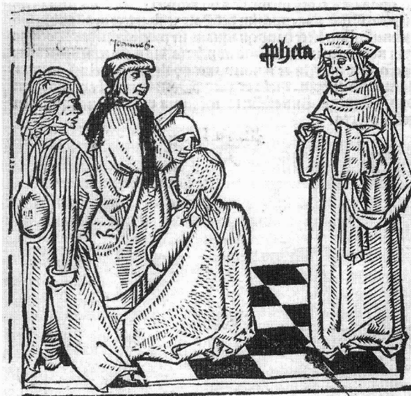
Middeleeuws onderwijs. Titelhoustnede uit Antonius Mancinellus, Versilogus cum commentariis Ioannis Murellii . Zwolle, Peter van Os van Breda, 24 Jan. 1507. (Deventer, SAB 101 B 4-j). Te zien in DEVENTER.

KEULEN Diözesan Museum: Glaube und Wissen im Mittelalter. Die Kölner Dombibliothek. 7 augustus - 15 november. Keuze uit Dombibliothek ter gelegenheid van 750-jarig bestaan van Keulse Dom. Er zijn veel mooie en interessante boeken te zien. Helaas ontbreekt historisch materiaal zoals oude catalogi. De grote catalogus is uitstekend (het gidsje minder).