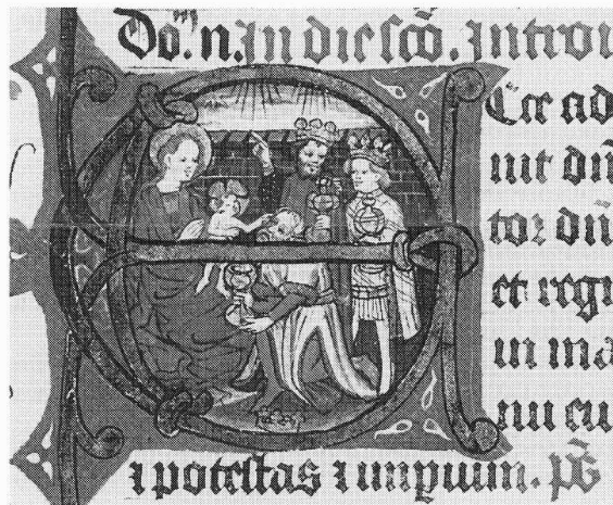
Anbidding van de Koningen. Nederrijns Missaal, ca 1430/1440. (Xanten, Stiftsarchiv, H 106). In GROTE; te zien in UTRECHT.

GROTE, Udo Der Schatz von St. Viktor. Mittelalterliche Kostbarkeiten aus dem Xantener Dom. Regensburg: Schnell und Steiner, 1998. 200 pp., ill. (kl.), geb. ISBN 3 7954 1136 x. f 49,50. Grondige studie van mooie, evenwichtige collectie incl. handschriften en gegevens over het Stiftsarchief en de Stiftsbibliothek Xanten. Bij reizende tentoonstelling, eerst in UTRECHT.